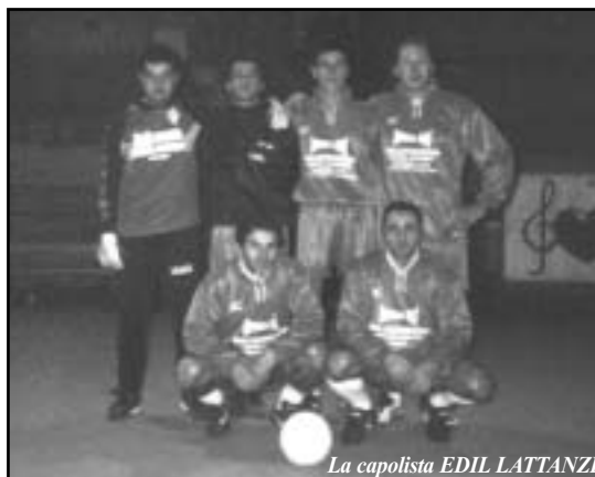
La capolista EDIL LATTANZI

ST, scesa al quarto posto con 24 punti. Si muove, invece, la coda della classifica, dove UMBERTO BERSANI ha scavalcato la X-FILES RAMACCI SPORT, mentre MOMENTI DI GIOIE è riuscita a vincere la seconda partita stagionale e la FEDO INFISSI, pur rimanendo tristemente in coda alla classifica con cinque punti, negli ultimi incontri è riuscita a mettere insieme una vittoria ed un pareggio. Per la cronaca c'è da segnalare che EDIL LATTANZI, ATLETICO FOGLIETTA, SANTONE S.R.L. e PAPERINK'S hanno giocato una partita in più.