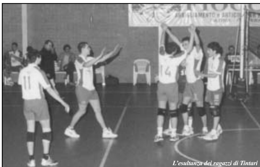
L'esultanza dei ragazzi di Tintari