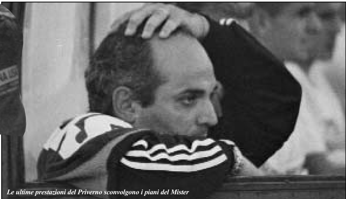
Le ultime prestazioni del Priverno sconvolgono i piani del Mister

Un'altra nota positiva riguarda gli impianti sportivi: finalmente si sta lavorando al risanamento e alla riqualificazione del campo polivalente di basket/pallavolo di San Lorenzo, e presto saranno sistemati gli impianti di riscaldamento al Palazzetto dello Sport e agli spogliatoi dello stadio comunale.